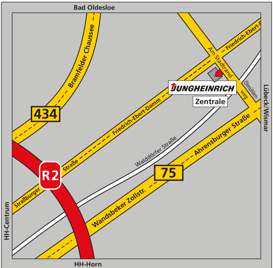
Vom Ring 2 zum Friedrich-Ebert-Damm